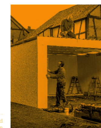
Maß nehmen und Maß halten