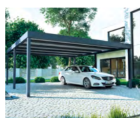
Carport oder Garage werden auf Architektur und Grundstück abgestimmt

»Wir planen nicht nur die Garage, sondern vermessen den vorgesehenen Standort auf dem Grundstück, setzen den Bauantrag auf und beraten beim Fundamententwurf«, verdeutlicht Agathe Chachulski. MC Garagen bietet Full Service. Wenige Wochen später werden die individuell produzierten Elemente verschickt. Dank eines ausgefeilten Netzes an Logistikzentren garantiert das Unternehmen termingerechte Lieferungen innerhalb Deutschlands, in die Schweiz, nach Österreich, Frankreich oder Benelux. Die Montage durch Fachkräfte erfolgt in wenigen Stunden. Und auch danach ist für MC Garagen noch lange nicht Schluss: »Sollten im Nachhinein Fragen aufkommen, stehen wir weiterhin mit Rat und Tat zur Seite. Denn wir verstehen uns als langfristige Partner unserer Kunden.«