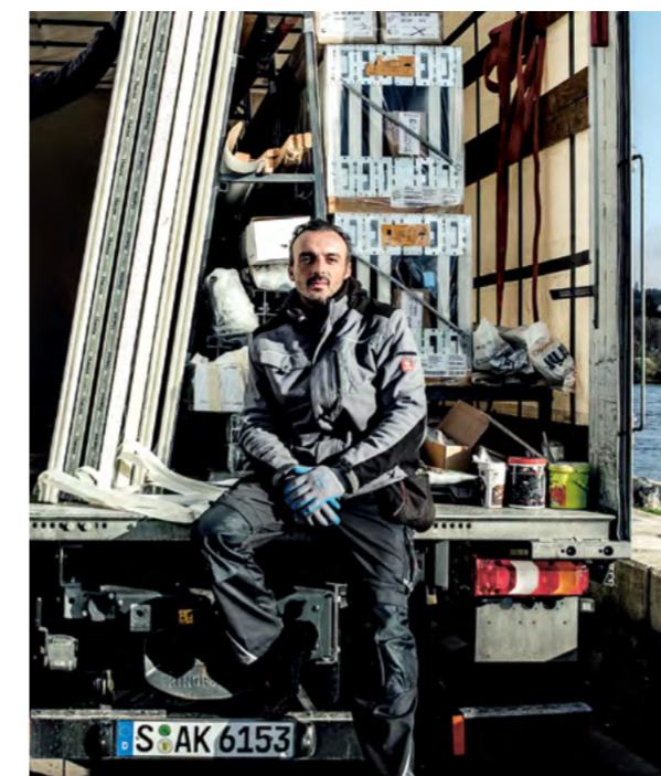
Ankunft des Lkw