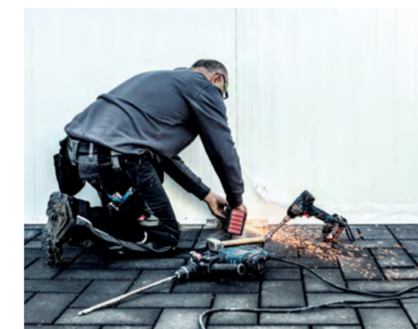
Keine Baustelle ist gleich: Das Team stellt sich auf alle Voraussetzungen bestens ein