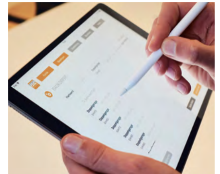
Übersichtlich und intuitiv: die Benutzeroberfläche der App

Die Erwartungen, die der Kunde an den Vertrieb hat, steigen stetig. Er möchte in möglichst kurzer Zeit umfassende Informationen zum Unternehmen und zu den Produkten erhalten. Um dem gerecht zu werden, hat MC Garagen für das große Angebot an Garagen und Carports eine innovative App für Tablet und Smartphone entwickelt.