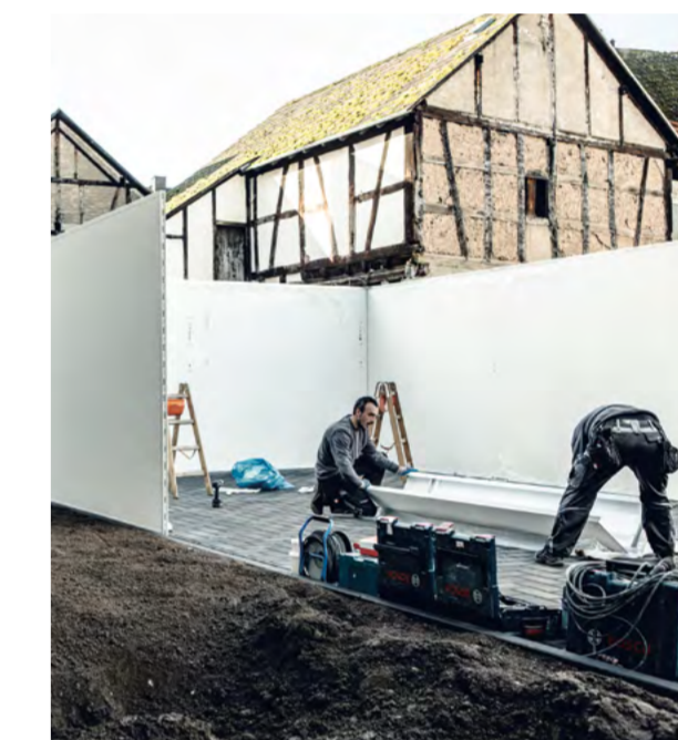
Ein eingespieltes Team

Schattig und kalt ist es im Hinterhof. Das Team gönnt sich eine kleine Kaffeepause vor dem Haus. Dort ist Sonne und der Blick auf den Rhein: »Das tut gut.« Weiter geht's: Die Dachbleche werden verschraubt, die Seitenblenden montiert. Jetzt noch das Sektionaltor von Hörmann mit Doppelzugfeder für maximale Sicherheit. Und ganz zum Schluss die Feinarbeiten: das Verschließen der Fugen und das Aufsaugen der Bohrspäne.